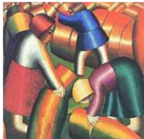
Kazimir Malevič La raccolta della segale , 1912

Scopo dell'evento è quello di offrire spunti di riflessione sui gruppi terapeutici nelle istituzioni preposte alla cura delle patologie psichiatriche. Lo strumento 'gruppo' è sempre più diffuso e attuale. Condurre un gruppo in istituzione implica, tuttavia, un adattamento del setting e della tecnica di conduzione in relazione ai diversi contesti istituzionali (Dipartimenti di Salute Mentale, Servizi di Neuropsichiatria dell'Età Evolutiva, Terzo Settore) e a diversi soggetti (adulti, età evolutiva, famiglie).