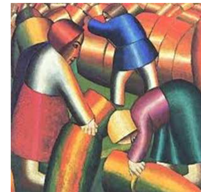
Kazimir Malevič Raccolta della segale , 1912