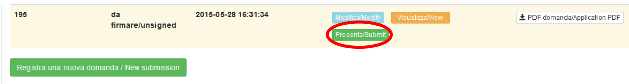
Fig. 13 – Presentazione della domanda / Submission of the application