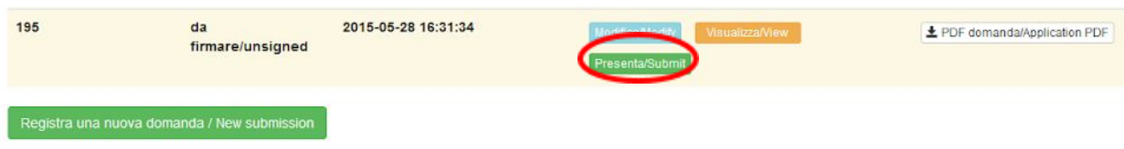
Fig. 13 – Presentazione della domanda / Submission of the application